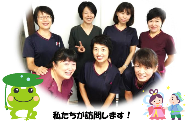
私たちが訪問します！