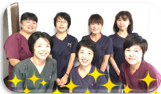
私たちが訪問します！

ご利用者さんはもちろん、ご家族の方々のお話しいいももしっかり受け止め、おだやかに過ごせるお手伝いができたら…と思っています。 よろしくお願いします！