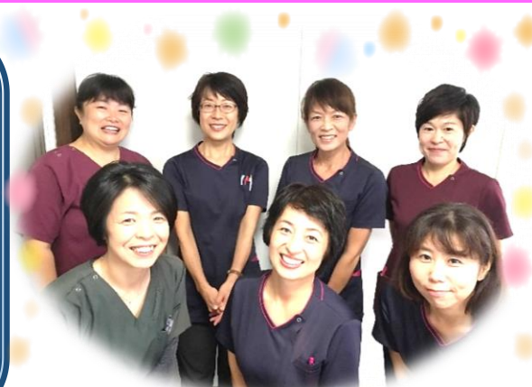
今年1年ありがとうございました！